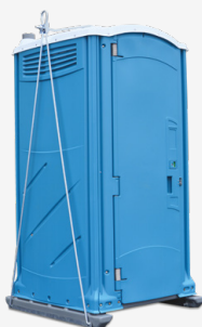
Zestaw do podnoszenia kabiny z pełnym zbiornikiem

Dodatkowo w naszej ofercie znajdują się akcesoria takie jak: dozownik mydła, dozownik ręczników papierowych, półka narożna, wskaźnik płci, lustro, oświetlenie, wieszak na papier toaletowy (4 rolki) i wentylator zasilany energią słoneczną.