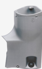
Mała miska Pojemność: 32.5L